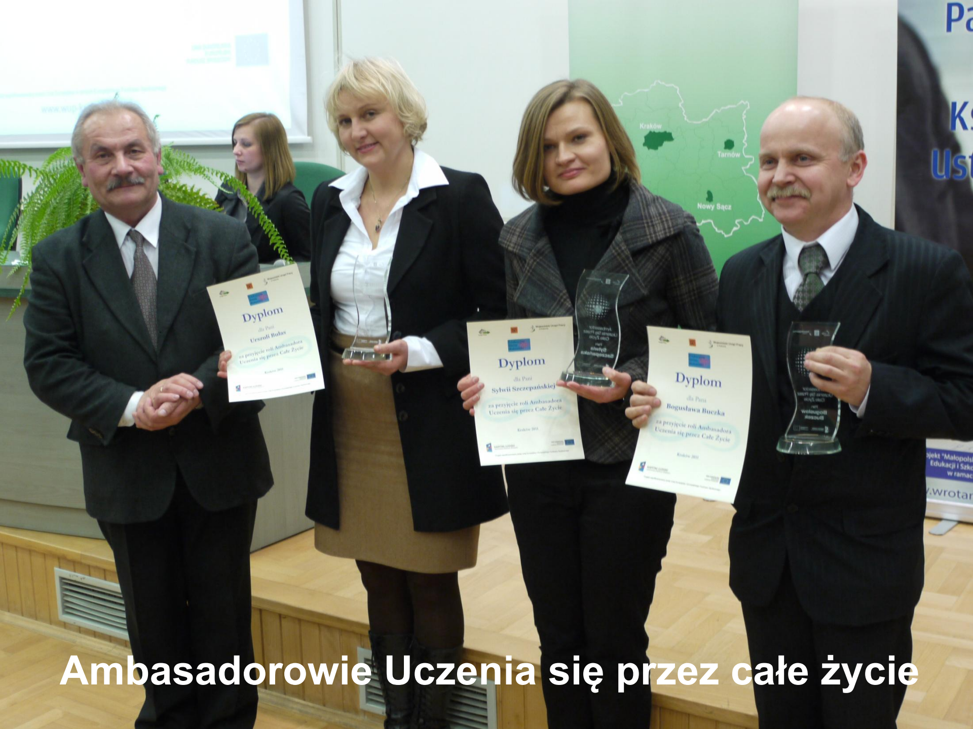
Ambasadorowie Uczenia się przez całe życie