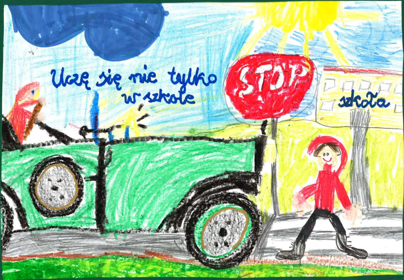
Miejsce I: Mikołaj Kłosowski Zespół Szkół nr 1 w Męcinie